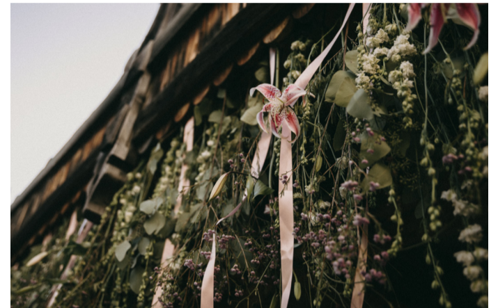
HOCHZEIT IM HOTEL SARATZ EIN HOTEL, DAS ELEGANT, MODERN UND MIT DER NATUR VERBUNDEN IST.

Die Aussicht auf den Roseggletscher, zusammen mit dem charmanten, in der Natur eingebetteten Strauss-Pavillon, verleiht dem Ambiente das gewisse Etwas und bietet Ihnen die perfekte Location für Ihren Traumtag.